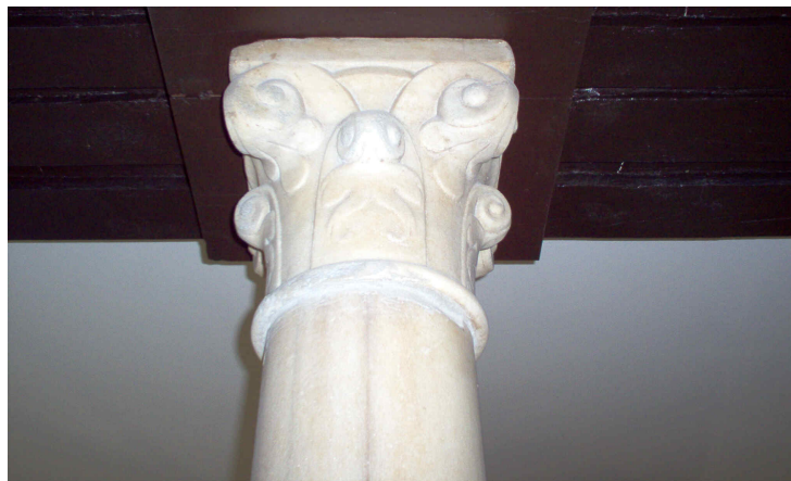
Capitel columna de mármol