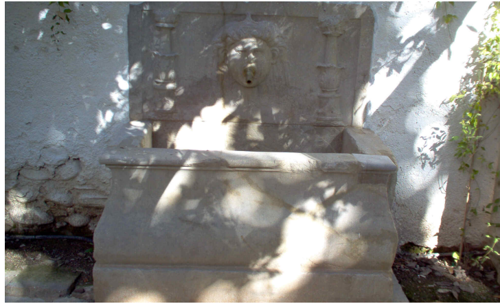
Pilar del jardín