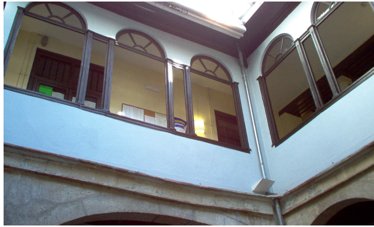
Galería primera planta