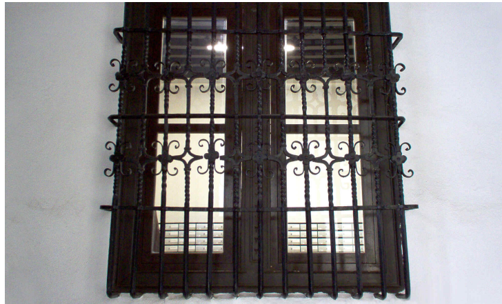
Ventana exterior enrejada