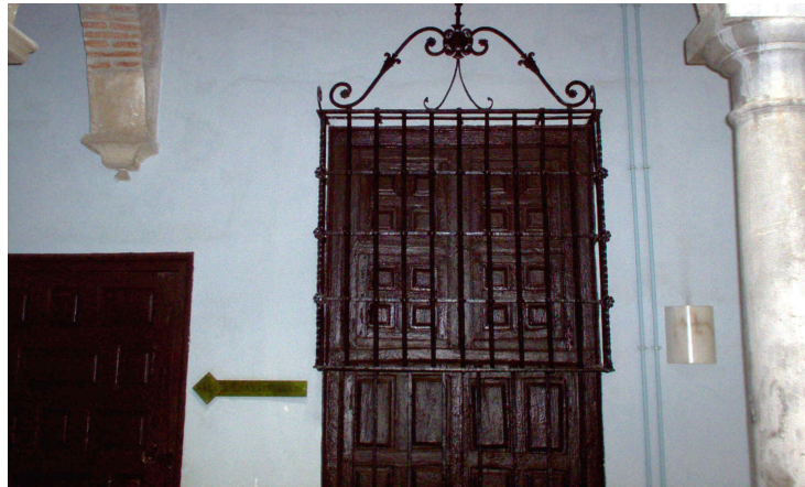
Reja ventana interior